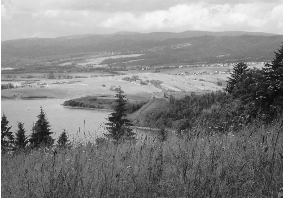
Fot. 3. Widok z jednej z polan pod Łysą Górą na zamek Czorsztyn. The view from one of the glades on Łysa Góra mountain towards Czorsztyn castle.