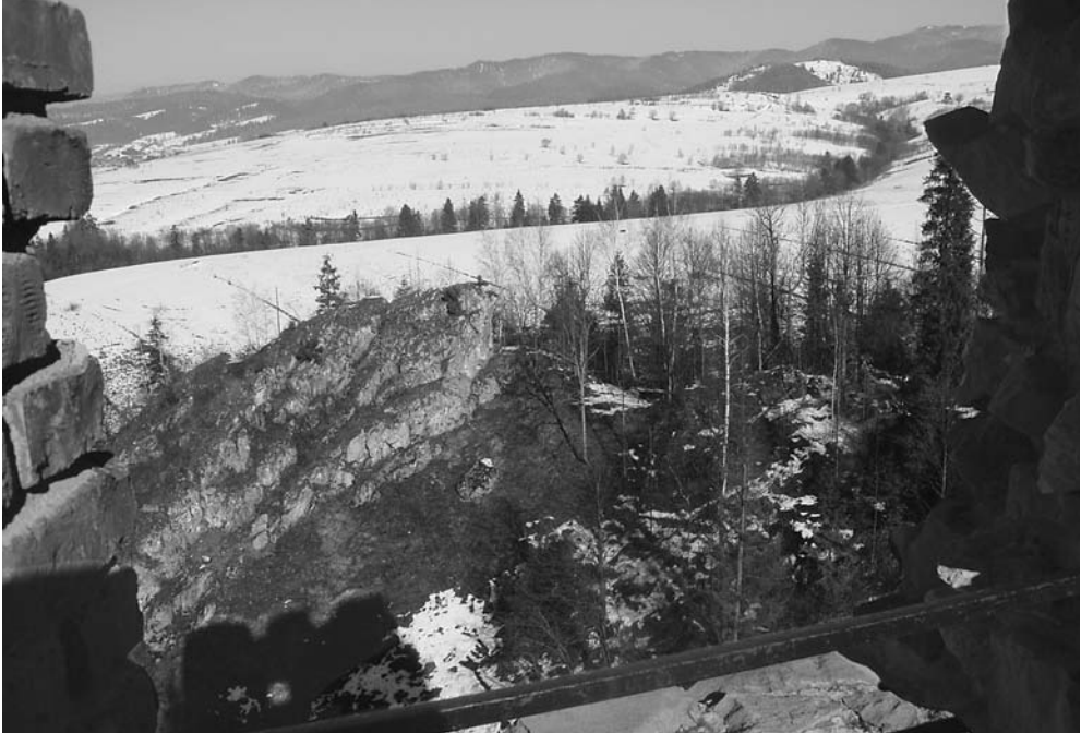
Fot. 10. Widok z Baszty Baranowskiego na pasmo Lubania. The view from the Baranowski Tower towards Lubania mountain.