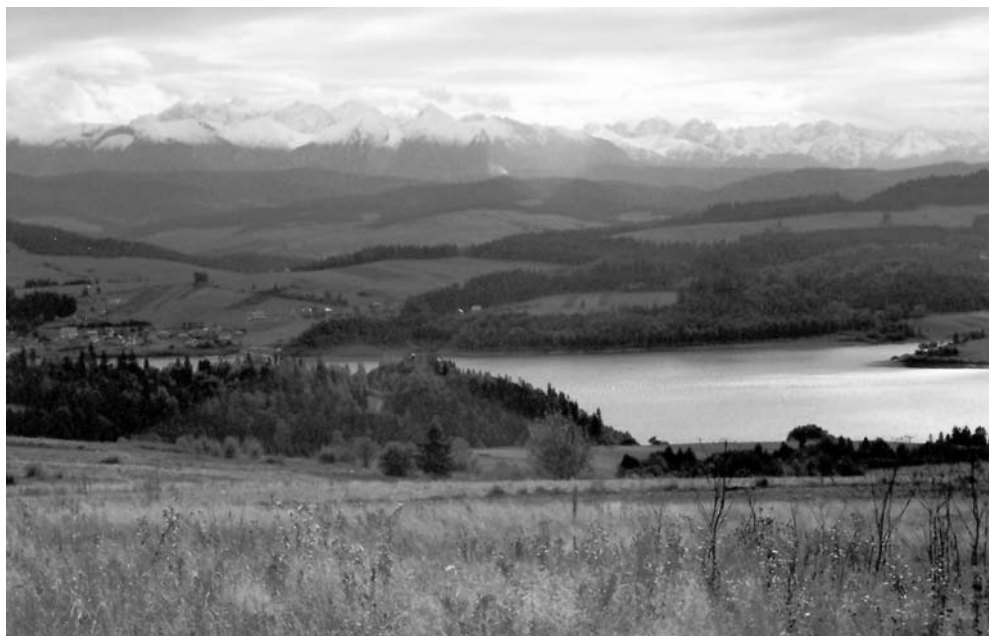
Fot. 2. Widok z Wielkiego Pola w stronę południową. The view from the area of Wielkie Pole towards the south.