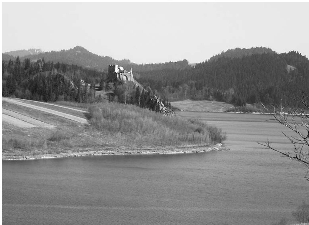
Fot. 1. Widok z półwyspu Stylchen w stronę zamku Czorsztyń i Pienin. The view from the Stylchen peninsula towards Czorsztyń castle and the Pieniny mountains.