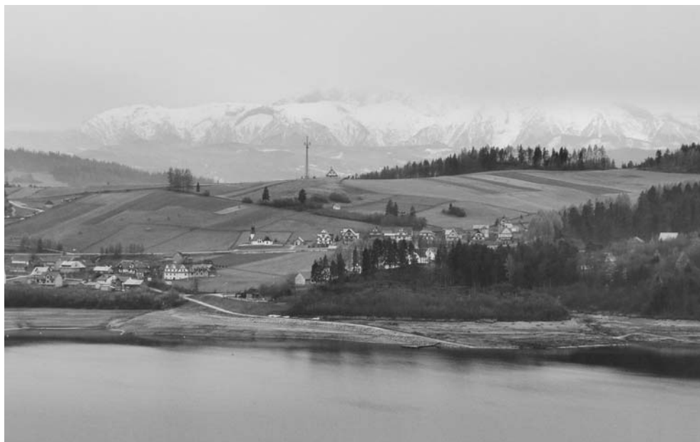
Fot. 9. Widok z tarasów w poziomie I piętra zamku górnego w stronę południową. The view from the terrace at the level of the 1 st floor of the castle towards the south.