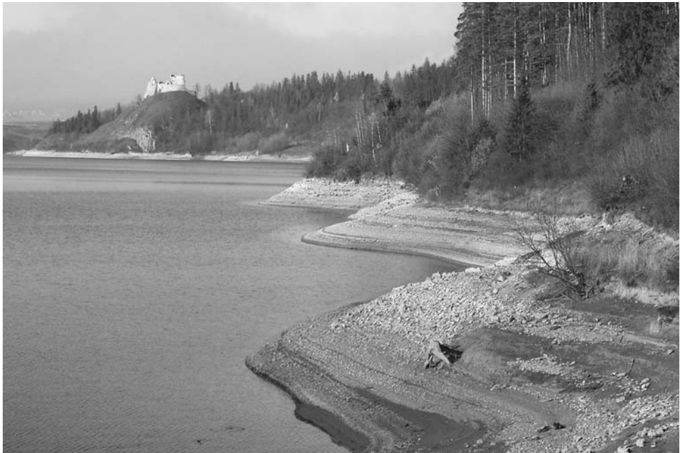
Fot. 4. Widok z brzegu jeziora Czorsztyńskiego pod Cisową Skalką, w stronę północną. The view from the shore of the Czorsztyn reservoir under Cisowa Skalka towards the north.