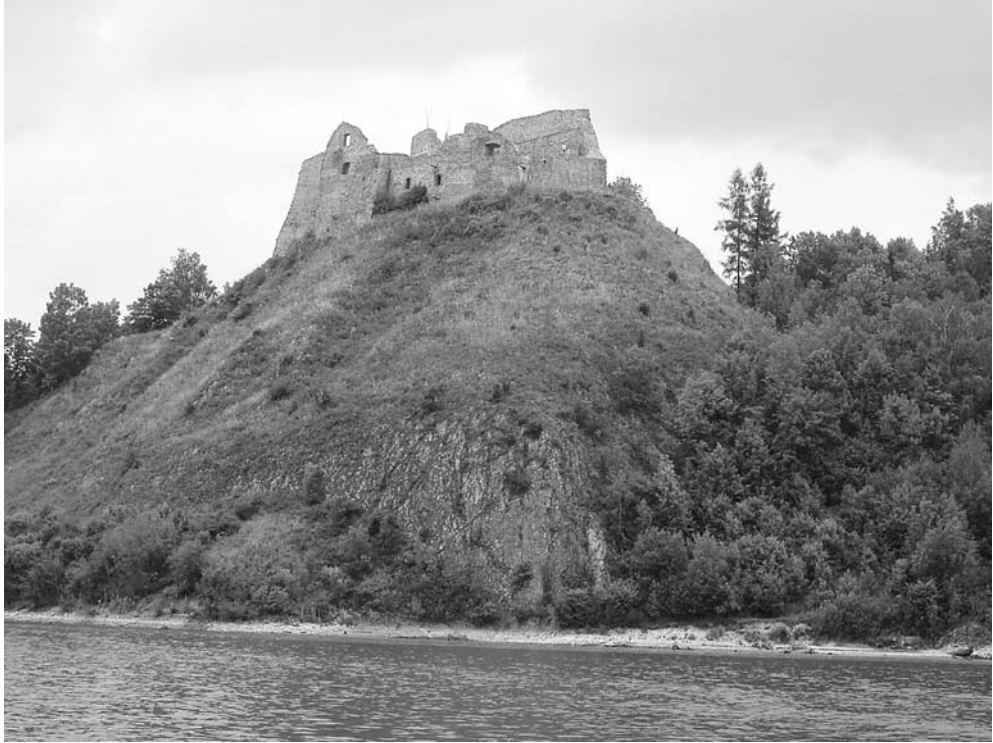
Fot. 7. Widok z jeziora Czorsztyńskiego na wzgórze zamkowe w Czorsztyń. The view from the Czorsztyń reservoir towards castle hill in Czorsztyń.

na tle Wielkiego Pola i Gorców i choć niewielki w tym otoczeniu – jest wyraźnym akcentem, zwłaszcza przy porannym i wieczornym (tj. bocznym) oświetleniu.