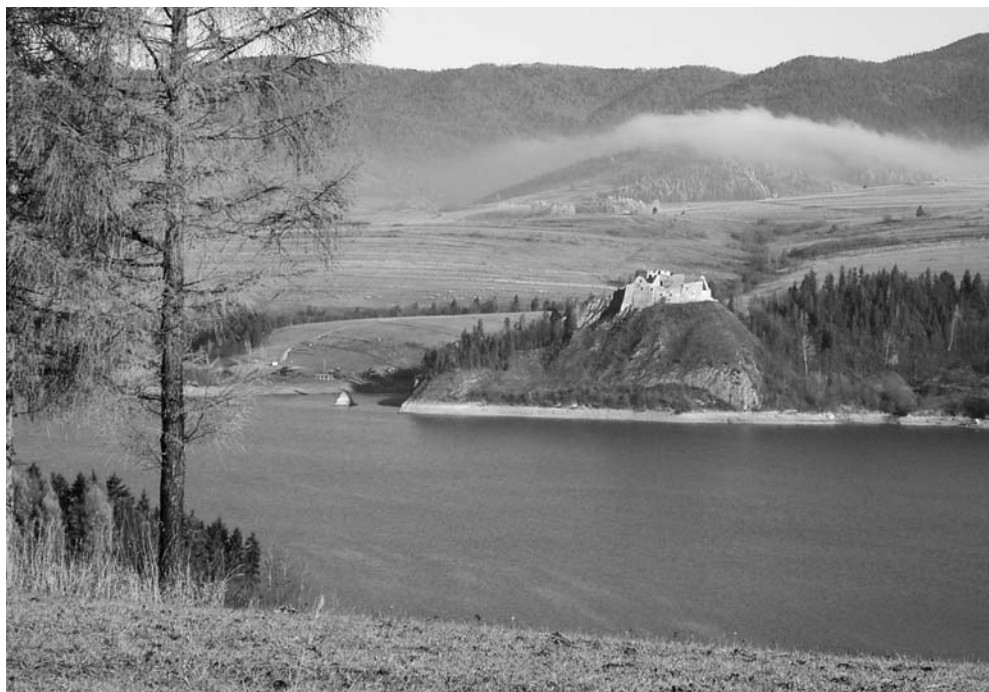
Fot. 6. Widok z Taboru na zamek Czorsztyn i pasmo Lubania. The view from Tabor hill towards Czorsztyn castle and the the Lubania range.