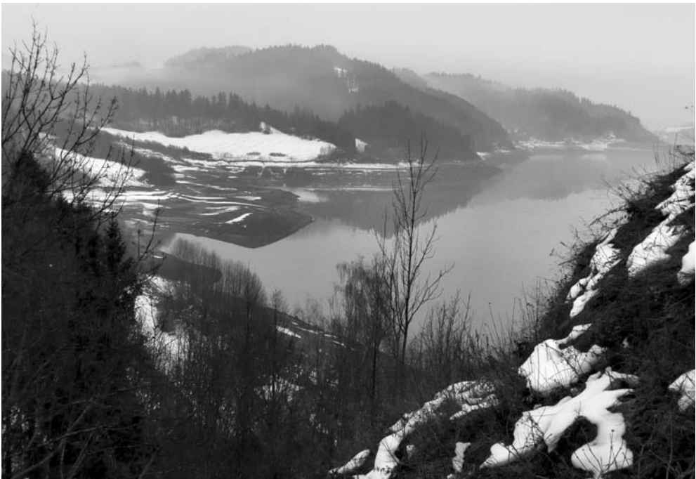
Fot. 11. Widok na Pieniny z podejścia do Drugiej Bramy. The view towards the Pieniny mountains from the entrance to the Second Gate.