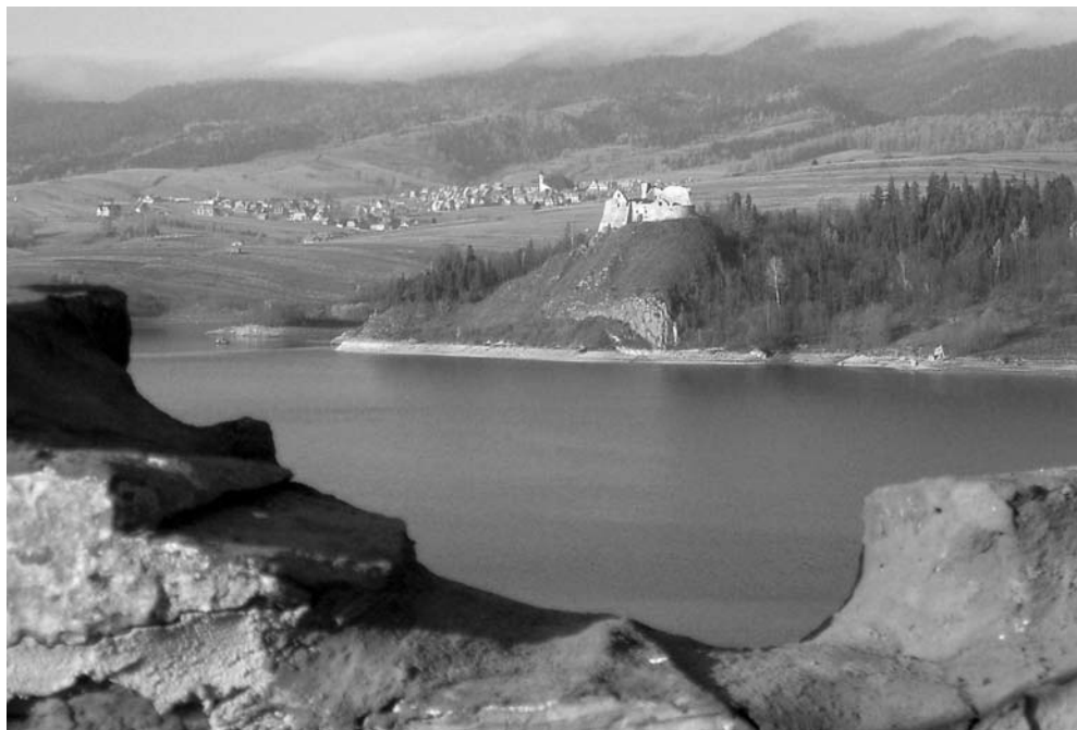
Fot. 5. Widok z zamku Dunajec w stronę zamku Czorsztyn. The view from Dunajec castle towards Czorsztyn castle.