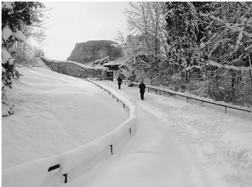
Fot. 8. Widok z drogi prowadzącej do ruin zamku w Czorsztynie. The view from the road leading to the ruins of Czorsztyn castle.